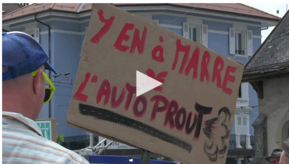
Manifestation contre la bretelle autoroutière de Chavannes-près-Renens.

Canton de Vaud Environ 200 manifestants ont protesté samedi après-midi contre la future construction d'une bretelle autoroutière dans l'Ouest lausannois.