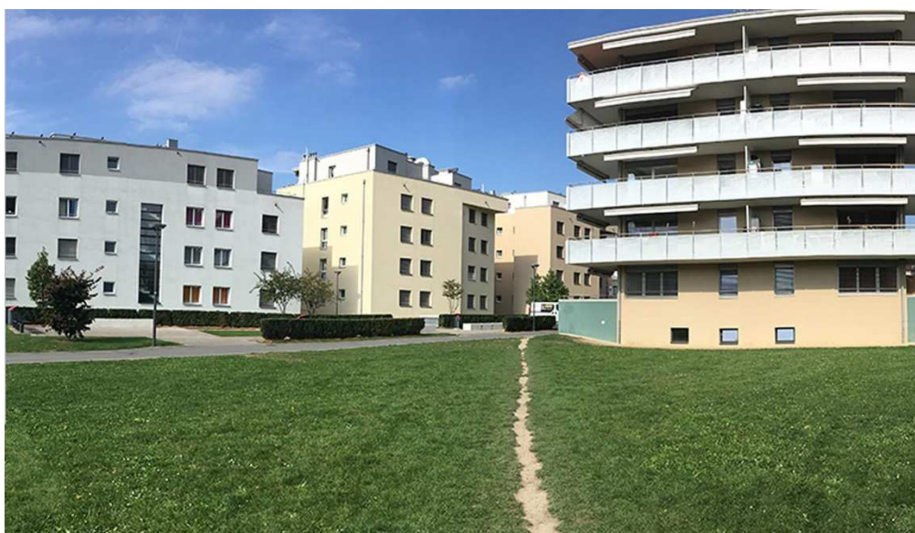
Illustration de la « ligne de désir »

Il est proposé de maintenir et de renforcer « la ligne de désir » tracée par les usagers et traversant la parcelle de sud-est en nord-ouest par la mise ne place de gravier stabilisé (surface perméable) et de formaliser ainsi l'existence d'un chemin, débouchant sur une placette au nord-est, lieu de rencontre et de lien avec le quartier des Ramiers et les aménagements existants.