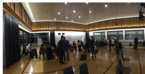
Atelier du 8 février 2017

Ainsi, le 8 février 2017, la commune et Equiterre ont organisé un atelier participatif ; plus de trente personnes étaient présentes. Une première étape de cet atelier a consisté à demander aux participants d'indiquer où ils souhaiteraient créer des potagers urbains. Une dizaine de personnes ont mentionné la parcelle 48.