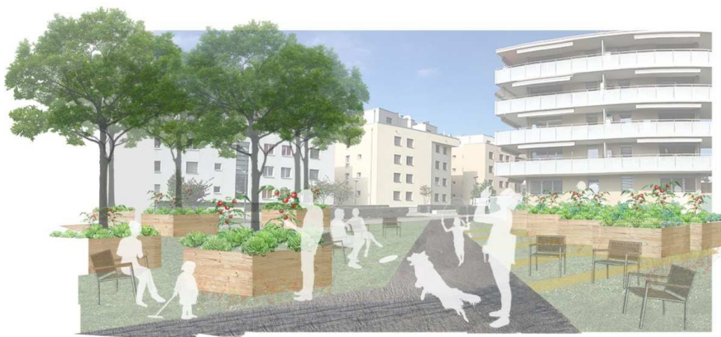
Illustration du parc

Il est proposé de maintenir et de renforcer « la ligne de désir » tracée par les usagers et traversant la parcelle de sud-est en nord-ouest par la mise ne place de gravier stabilisé (surface perméable) et de formaliser ainsi l'existence d'un chemin, débouchant sur une placette au nord-est, lieu de rencontre et de lien avec le quartier des Ramiers et les aménagements existants.